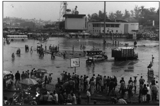
Figure 4: Inondation catastrophique de février 2000 au rond-point de la poste centrale à Yaoundé.