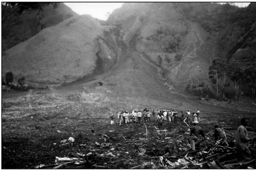
Figure 3: Un des multiples glissements de terrain et coulées boueuses catastrophiques du 20 juillet 2003 à Magha, dans la Caldeira des Monts Bamboutos (Ouest Cameroun).