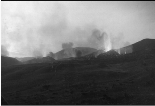
Figure 1 : Vue d'une phase de l'activité éruptive du Mont Cameroun en 1999.