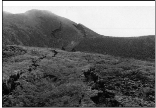
Figure 2: Effondrement consécutif à l'activité volcano-tectonique du Mont Cameroun en 2000.